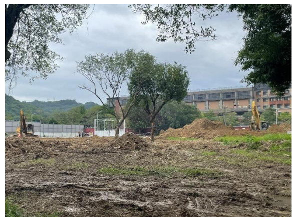
編號59 現況已無該樹木