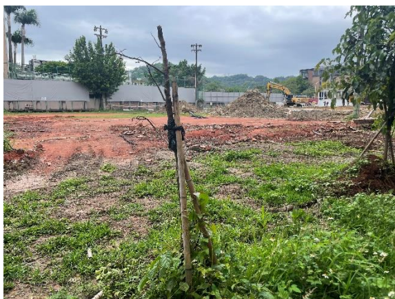
編號1 樹木生長狀況不佳建議移除